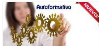
Recursos para Incorporar los Derechos Humanos de las Mujeres.