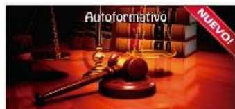
Los Mecanismos Internos de Protección y Promoción de los Derechos Humanos.