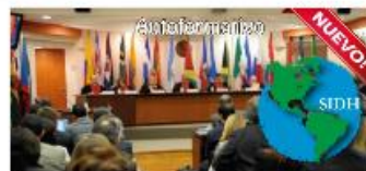
El Sistema Interamericano de Protección de los Derechos Humanos.